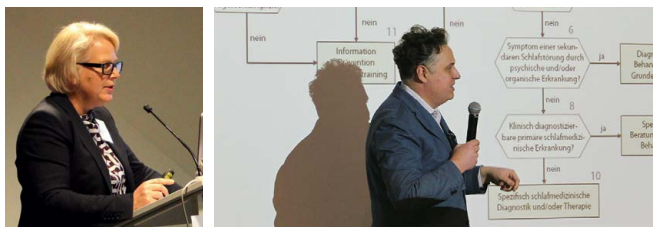
Eindrücke von der Jahrestagung 2018